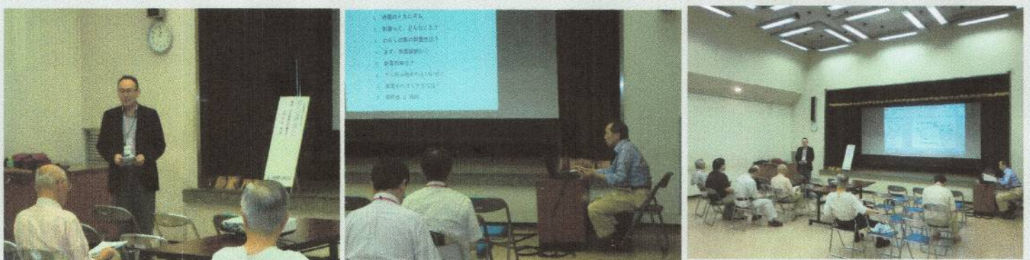
午後：講演会の様子