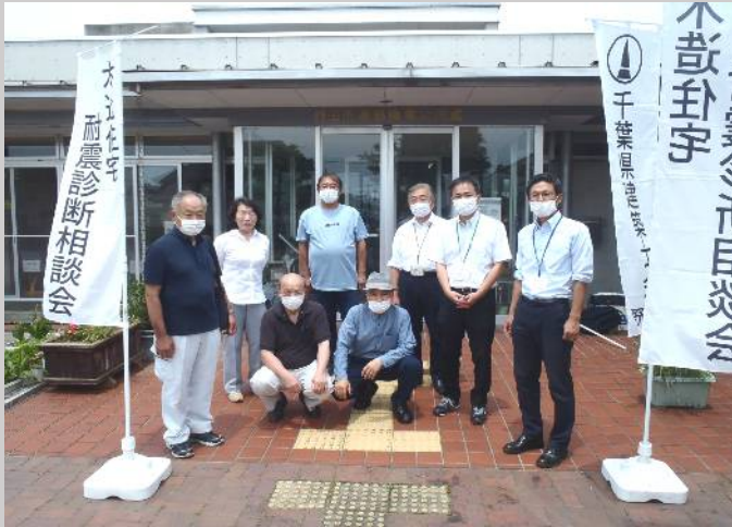
玄関前にて集合写真