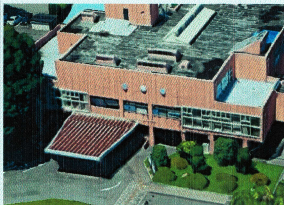
会場：野田市中央公民館外観