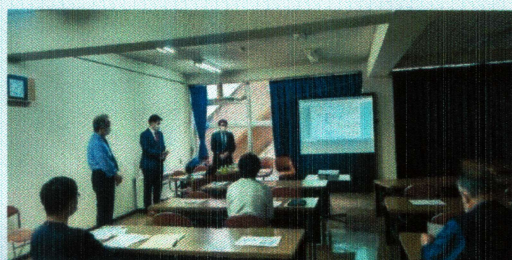
総会前の講習会の様子