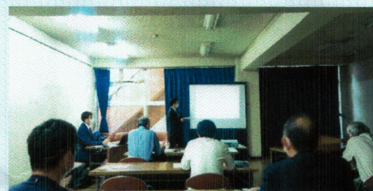
講師：UDI 確認検査株式会社 柏本部 担当